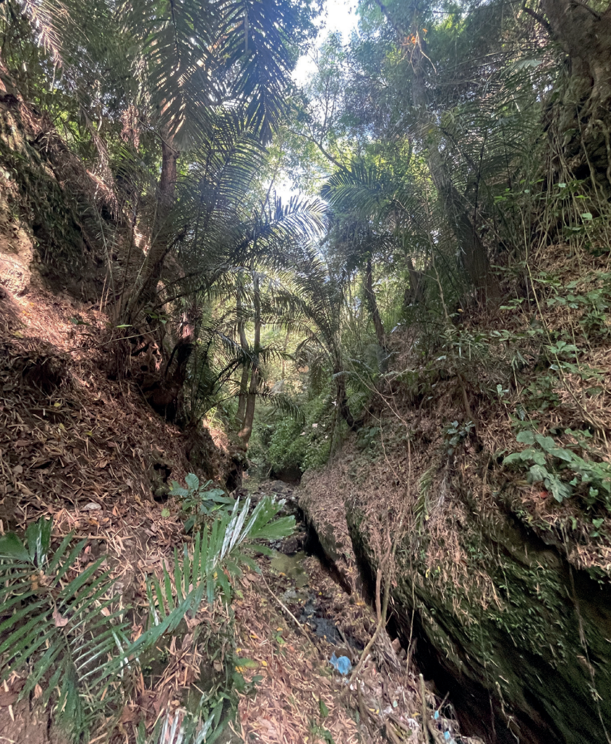
Schlucht in Mendez, Upland Cavite, Philippinen

Der ökologische Zustand unserer Erde ist in vielerlei Hinsicht alarmierend. Die Klimakrise schreitet rasant voran, die Biodiversität geht verloren und die sozialen Ungleichgewichte verschärfen sich zunehmend. In dieser Situation, in der schon die bisherigen Anstrengungen nur als halbherzig bezeichnet werden können und in der eigentlich ein weiteres konsequentes Handeln der Politik zur Rettung unser aller Lebensgrundlagen von Nöten wäre, erleben wir leider gerade genau das Gegenteil: auf allen Ebenen findet ein Roll-Back statt. Und das nicht nur im fernen Amerika