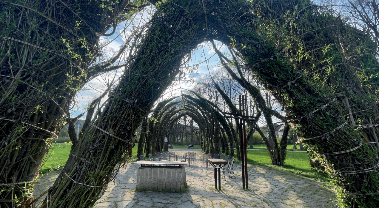
Weidenkirche der Evangelischen Jugend, Pappenheim