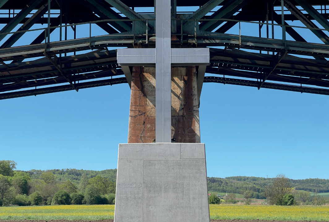
Eisenbahnbrücke bei Donauwörth