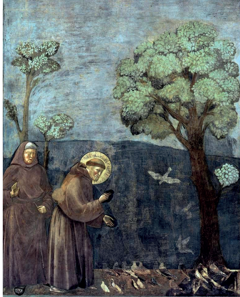
Giotto di Bondone: Vogelpredigt des hl. Franziskus, Fresko um 1295, Basilika San Francesco, Assisi.