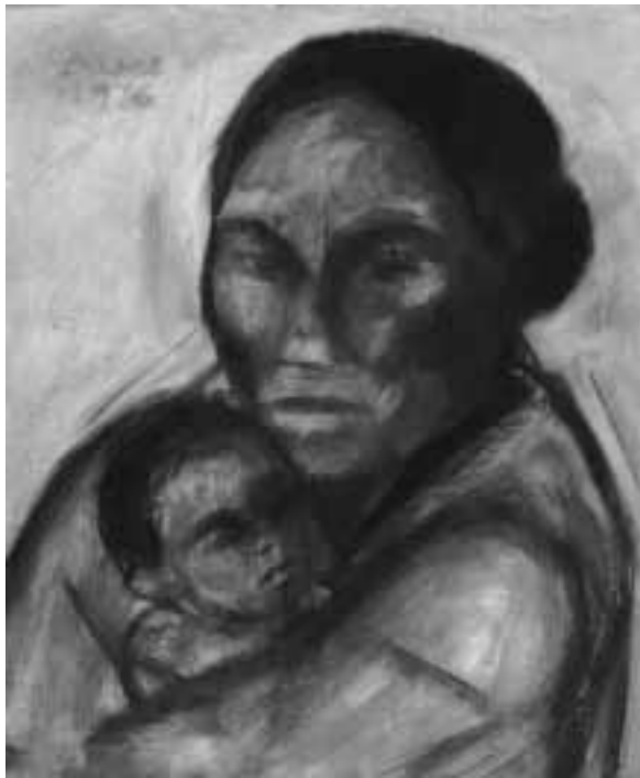
Pablo Baens Santos, Mutter und Kind (1979)

grund. So war es im arabischen Kalifat eine neue Sitte, die Statussymbole der byzantinischen und persischen Untertanen und Nachbarn zu übernehmen, und das waren der Schleier und der Harem. Religiös untermauert brachten sie allerdings die völlige Abhängigkeit der Frau von ihrem Besitzer.