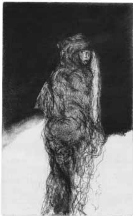
Der auferstandene Jesus erscheint Maria Magdalena, Thomas Zacharias (1992)

Damit kehrt Paulus zurück zu Gen 3,6. Daraus leitet sich die Dualität von Gut und Böse ab, nach der die Kirchenväter folgende Reihen bildeten: Gutes - Gott - Vernunft - Geist: