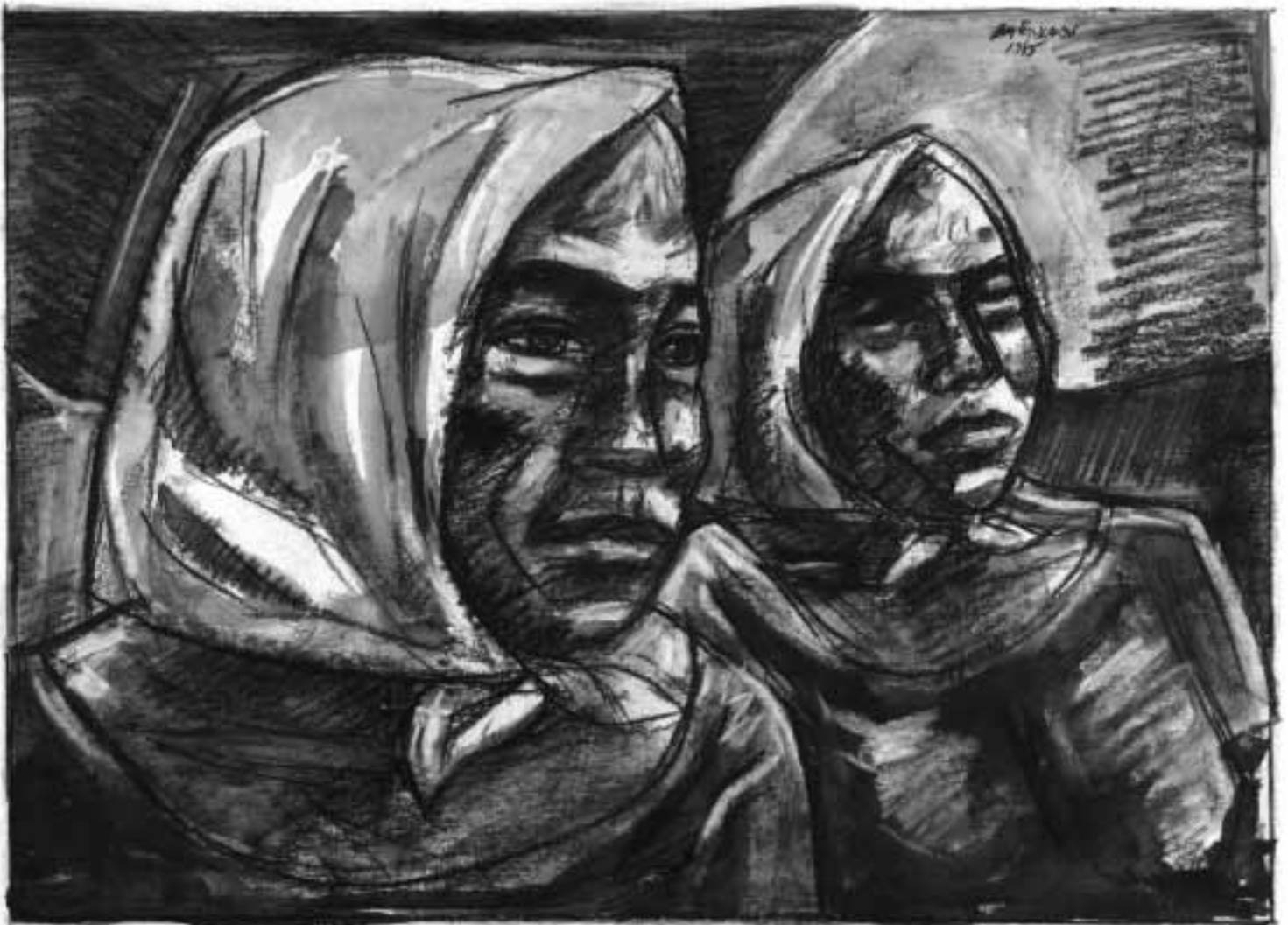
Pablo Baens Santos, Zwei Frauen (1989)