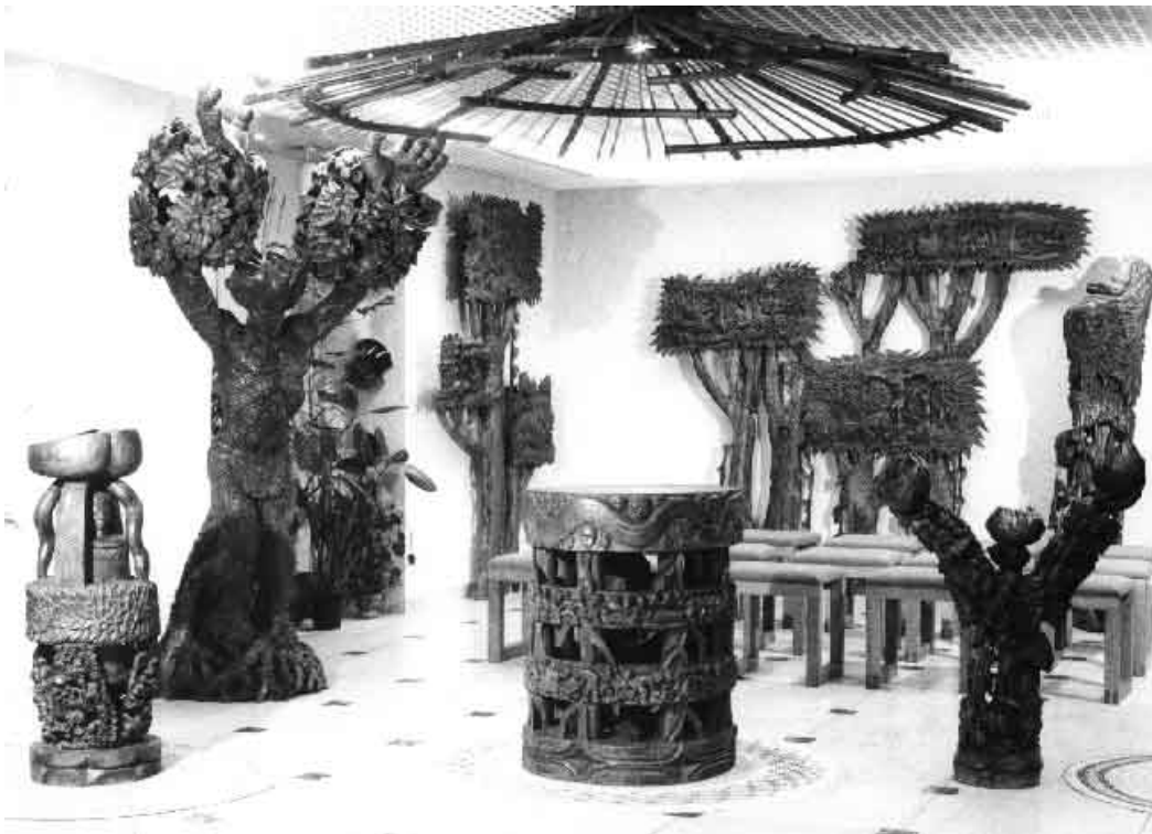
Gesamtansicht der Kapelle

Die Abbildungen zeigen die Ausstattung der Hauskapelle von Missio München, die vom Ku-Ngoni-Art-Craft-Center in Malawi gestaltet wurde.