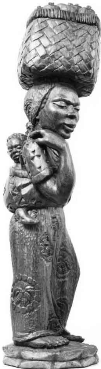
Die Madonna: Die Frau mit dem Kind und dem Maiskorb

Nonne“ die Massen in die Kinos zog und die Arbeit der Missionsschwester zum Traumberuf machte. Heute werden erhebliche Bedenken gegen Mission angemeldet. Man kritisiert die Mission, weil sie sich in den Dienst des kolonialen Imperialismus stellte und im festen Glauben an die eigene Überlegenheit fremde Kulturen zerstörte. Im Namen Gottes sei so getan worden, als gebe es außerhalb der Kirche kein Heil. Zu den historisch begründeten Vorbehalten gegenüber Mission fügt der postmoderne Indifferentismus der Gegenwart ein weiteres Argument hinzu, indem er behauptet, es sei völlig gleichgültig, ob und was jemand glaubt. In einer „offenen Gesellschaft“ könne es jedenfalls nicht angehen, jemanden bekehren zu wollen.