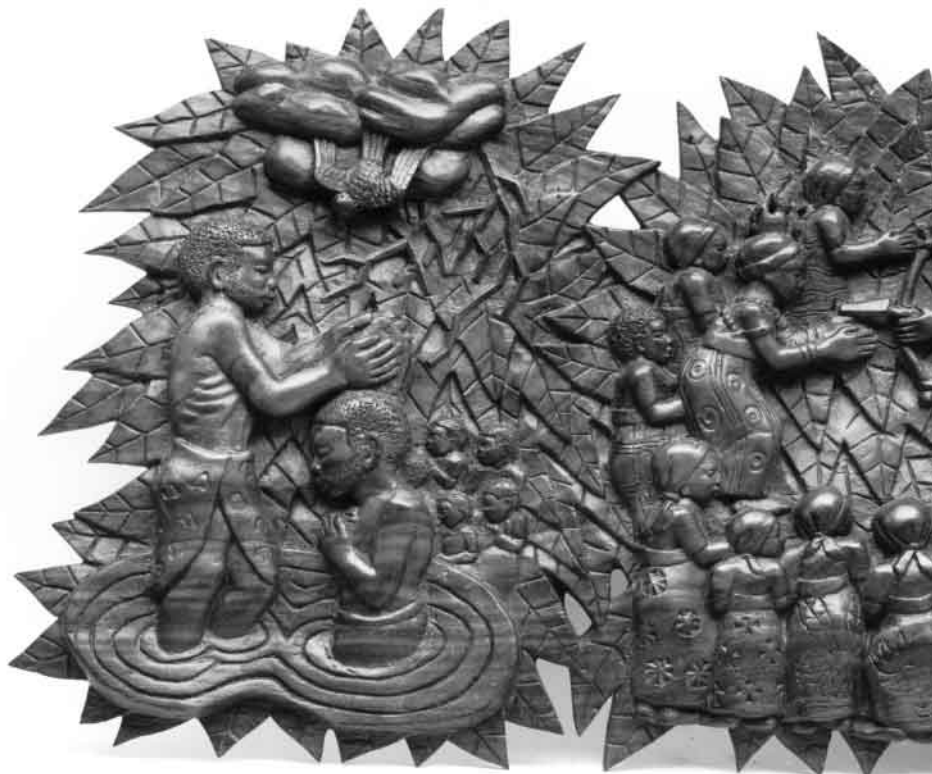
Die Taufe Jesu