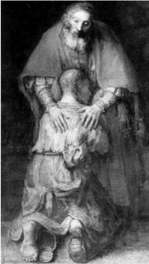
Rückkehr des Verlorenen Sohnes Rembrandt van Rijn, 1662 (Ausschnitt)

Liebe Leser, die Finanznöte der Kirchen sind auch an uns nicht spurlos vorübergegangen. »Begegnung und Gespräch« wird deshalb künftig nur noch dreimal im Jahr in den Monaten Januar, Mai und Oktober erscheinen können. Die Redaktion bittet um Ihr Verständnis.