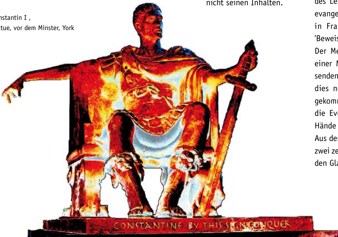
Konstantin I , Statue, vor dem Minster, York

Dawkins argumentiert als Evolutionsbiologe. Die Evolution des Lebens wird vor allem im evangelikalen Amerika massiv in Frage gestellt. Aber die 'Beweislage' ist überwältigend. Der Mensch ist das Ergebnis einer Milliarden Jahre umfassenden Entwicklung, die überdies noch nicht an ihr Ende gekommen ist. Wir sind dabei, die Evolution in die eigenen Hände zu nehmen. Aus der Evolution ergeben sich zwei zentrale Argumente gegen den Glauben.