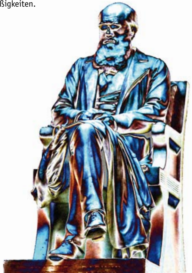
Charles Darwin Statue, Natural History Museum, London