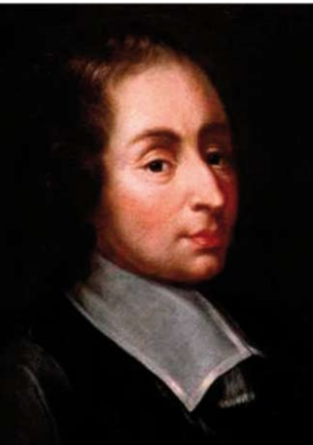
Blaise Pascal

Die Frage: ‚Glauben Sie an Gott?‘ wird mancher leichtthin mit ‚Ja‘ beantworten. Fragt man weiter, wird es schwierig. Sofort kommen unterschiedliche Auffassungen zum Tragen, weil Glaubensüberzeugung durch je eigene Erfahrungen und gedankliche Voraussetzungen geprägt sind: GOTT, was für ein einfaches Wort und welcher Horizont an Bedeutungen!